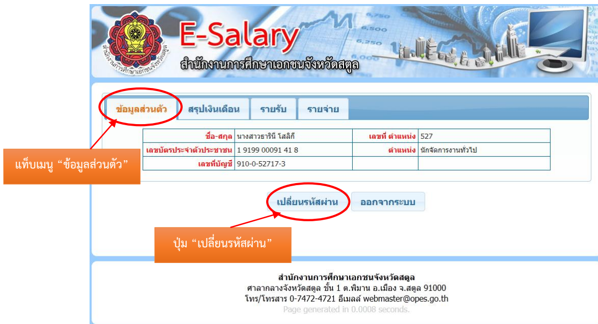
ภาพที่ 5 หน้าสำหรับเปลี่ยนรหัสผ่าน

หากผู้ใช้ต้องการเปลี่ยนรหัสผ่าน ให้ไปที่แท็บเมนู “ข้อมูลส่วนตัว” แล้วเลือกปุ่ม “เปลี่ยนรหัสผ่าน” ด้านล่างของตาราง ดังภาพที่ 5