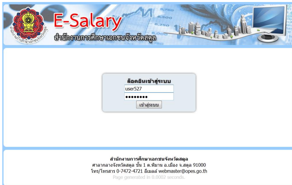
ภาพที่ 1 หน้าต่างเข้าสู่ระบบ (Login)

พิมพ์ URL http://www.esalary.opes.go.th จะปรากฏฟอร์ม Login ดังภาพที่ 1