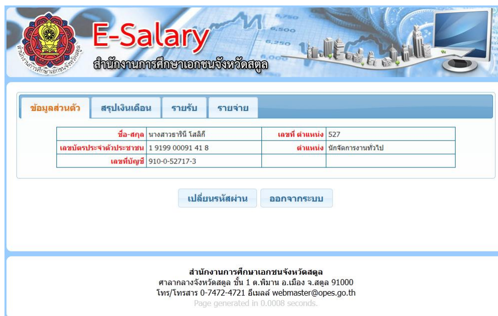
ภาพที่ 2 หน้าข้อมูลส่วนตัว

ให้ใส่รหัสผู้ใช้ (User name) และ รหัสผ่าน (Password) ตามที่ สำนักงานการศึกษาเอกชนจังหวัดสตูลได้ กำหนดให้ แล้วกดปุ่มเข้าสู่ระบบ เมื่อเข้าสู่ระบบจะปรากฏหน้าข้อมูลส่วนตัวของผู้ใช้ ดังภาพที่ 2